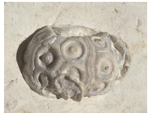
Fig. 17. Temnocidaris ovatus

On distingue les Oursins réguliers à symétrie rayonnante comme Temnocidaris septifera , Echinocorys ovatus , Phymosoma sp.