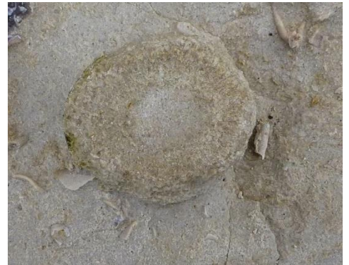
Fig. 4. Éponge du genre Siphonia .

Pour les plus simples, la forme est celle d'une poche dont la paroi est percée d'orifices et soutenue par un « squelette » formé de pièces microscopiques calcaires ou siliceuses, les spicules . (Parfois trouvés en abondance dans la roche).