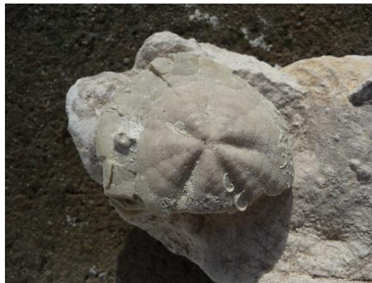
Fig. 18. Micraster glypheus

Les FORAMINIFÈRES sont des animaux microscopiques (unicellulaires)