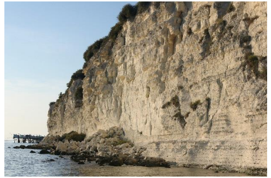
Fig. 2. Les falaises ouest, est et celle bordant la Gironde. ▼

Outre le fait que ces éboulis protègent le pied de la falaise, ils fournissent des fragments de roches de la partie supérieure dans lesquels sont des fossiles très difficilement accessibles autrement. Fig. 1. Cônes d'éboulis au pied de la falaise. ►