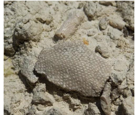
Fig. 6. Bryozoaire encroûtant ▶