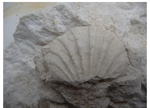
Fig. 8. Pecten dujardini

Diverses espèces du genre Pecten dont Pecten dujardini , Pecten asper ...Présence fréquente de Neithea quadricostata , Neithea sexangularis et Cremnoceramus sp.