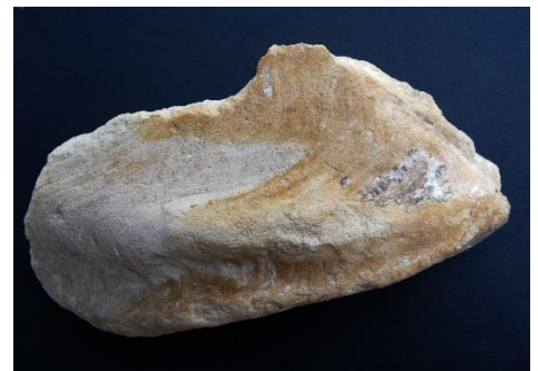
Fig. 16. Regoria ▶