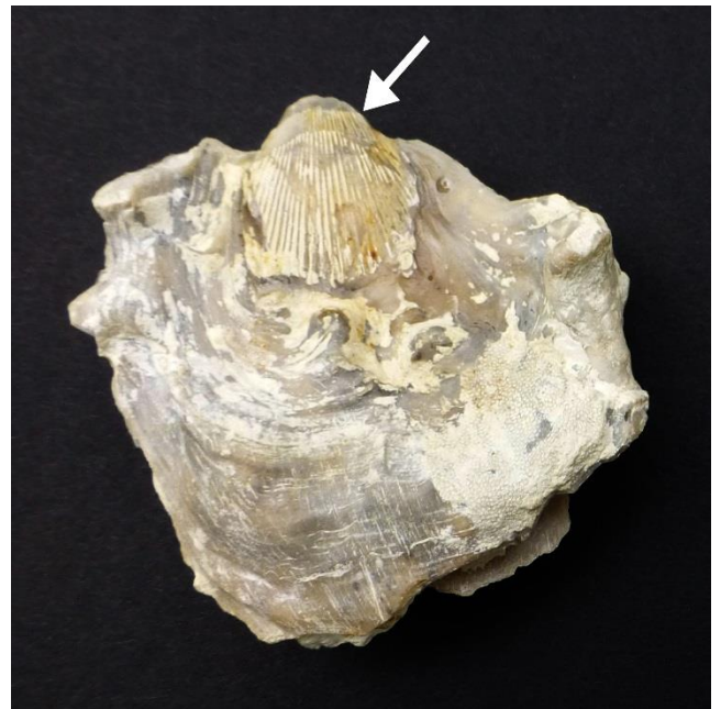
Fig. 12. P. vesicularis forme hippodium ►

Les genres sont nombreux et leur détermination difficile car la coquille est polymorphe. Elle a la particularité de se développer en prenant la forme du support ou de l'animal sur lequel se sont fixées les larves après leur vie nageuse. Un bon exemple nous est fourni par la forme hippodium de P. vesicularis . Sur l'image de la figure 12, on peut voir une sorte de "chimère" formée par l'huître et un brachiopode. La larve d'une huître s'est fixée à la coquille d'une Terebratelle (flèche) puis a continué son développement.