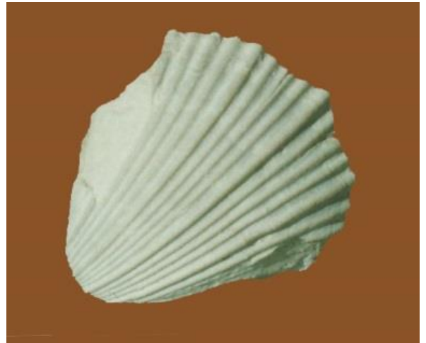
Fig. 10. Neithea sexangularis