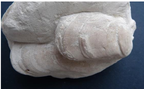
◀ Fig. 15. Septifer

Le corps est entouré par une coquille à 2 valves symétriques. Sur la face ventrale, rectiligne, les filaments du byssus assurent la fixation au support. Septifer lineatus est de petite taille et semblable à la moule actuelle. Regoria dufrenoyi est plus grosse avec des stries de croissance ondulées.