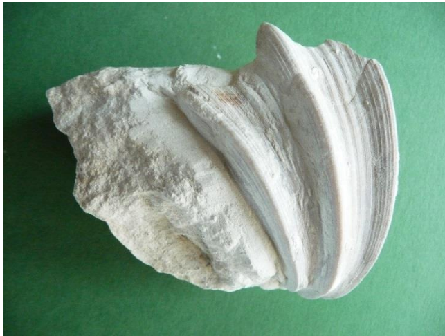
Fig. 9. Neithea quadricostata