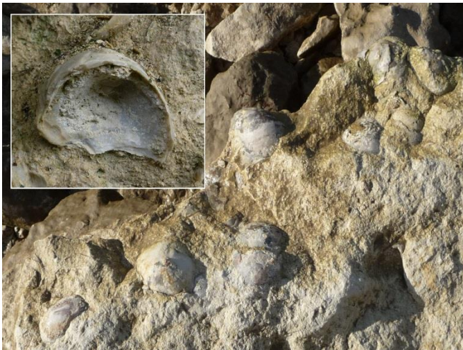
Fig. 11. Pycnodonte vesicularis ▲

Une espèce est bien représentée ici : Pycnodonte vesicularis dispersée ou formant des accumulations : les lumachelles .